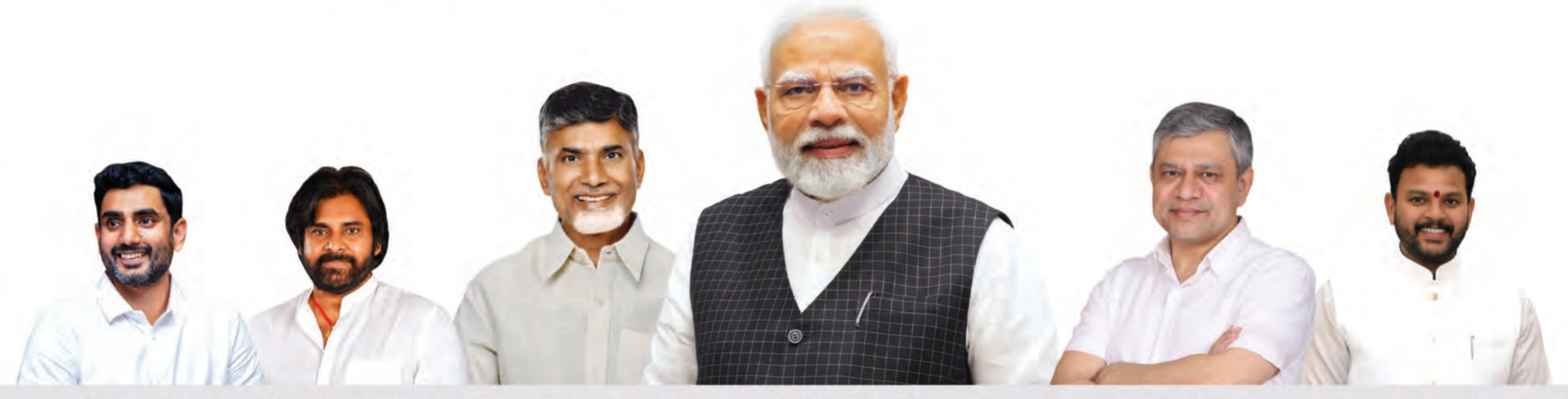
శ్రీ నారా లోకేష్ గౌరవనీయులైన ఐటీ మంత్రి ఆంధ్రప్రదేశ్

ఏబి హబ్ కు శంకుస్థాపన: స్వచ్ఛమైన గ్రీన్ ఎనర్జీ తో కూడిన కంప్యూటింగ్, కనెక్టివిటీ, కవరేజ్ ఒకే చోట.